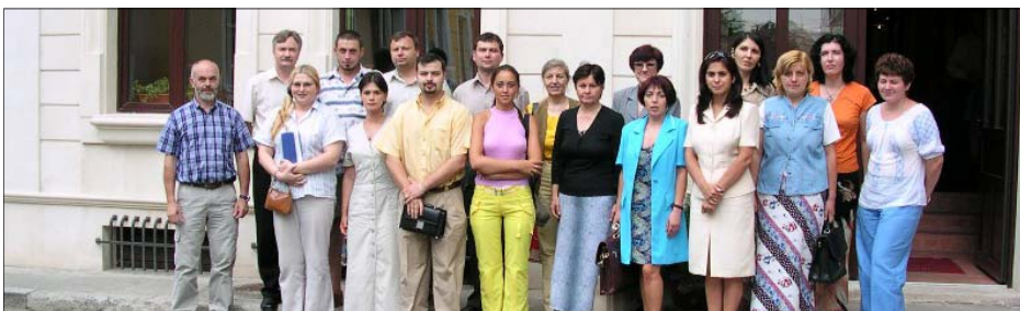
ADAM-cursus in Cluj-Napoca voor lokale verantwoordelijken en coördinatoren