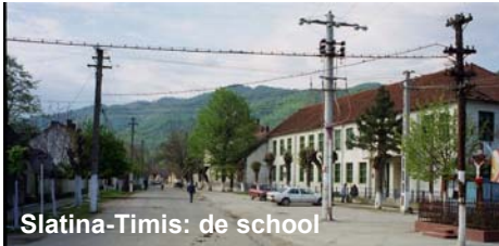
Slatina-Timis: de school