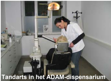
Tandarts in het ADAM-dispensarium

Ons ADAM-dispensarium begint ondertussen een regionale aantrekking te hebben. Mensen komen van omliggende gemeenten naar ons. Ze weten dat ze bij