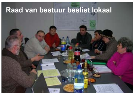
Raad van bestuur beslist lokaal