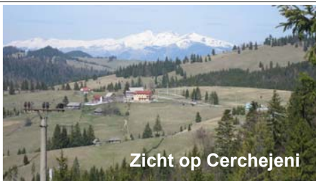
Zicht op Cerchejeni

“Tessengerlo helpt Roemenië” (Tessengerlo) met partner “Cerchejeni” (Botosani) gaat het gezondheidspro-